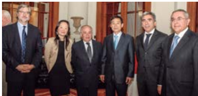
Foto: Inauguración Programa Instituto Rey Sejong, Noviembre 2012.

El Centro Asia Pacífico UDP participa activamente tanto en instancias nacionales como internacionales en el ámbito académico, público y empresarial. Ha dictado conferencias magistrales en: Stanford REELA, UCLA, Asociación de Centros de Estudios APEC, ICARE, SOFOFA, entre otros. Además, es una fuente de opinión y referente de información permanente en medios nacionales e internacionales de comunicación, con una participación activa en el mundo real de los negocios Asia-América Latina.